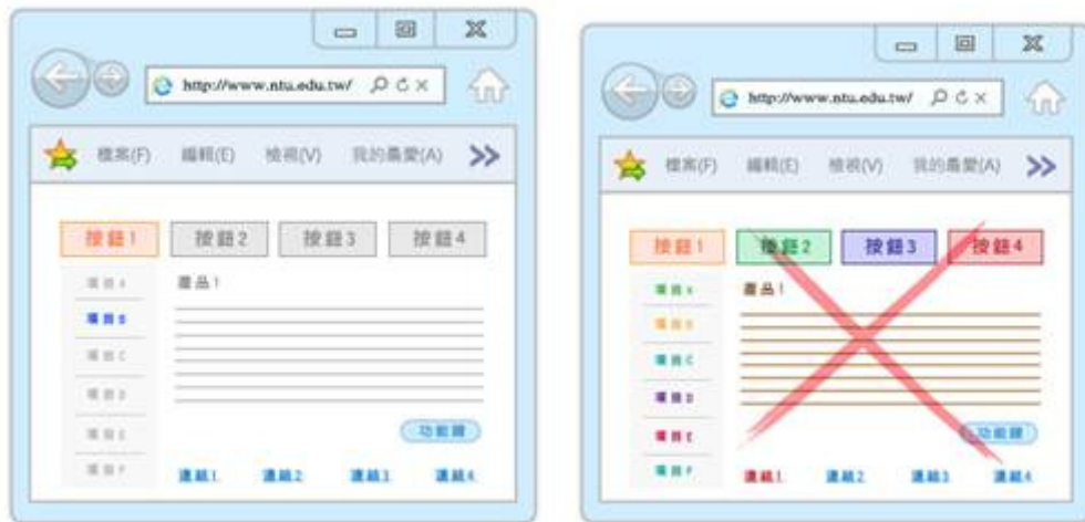
圖 10 圖 11