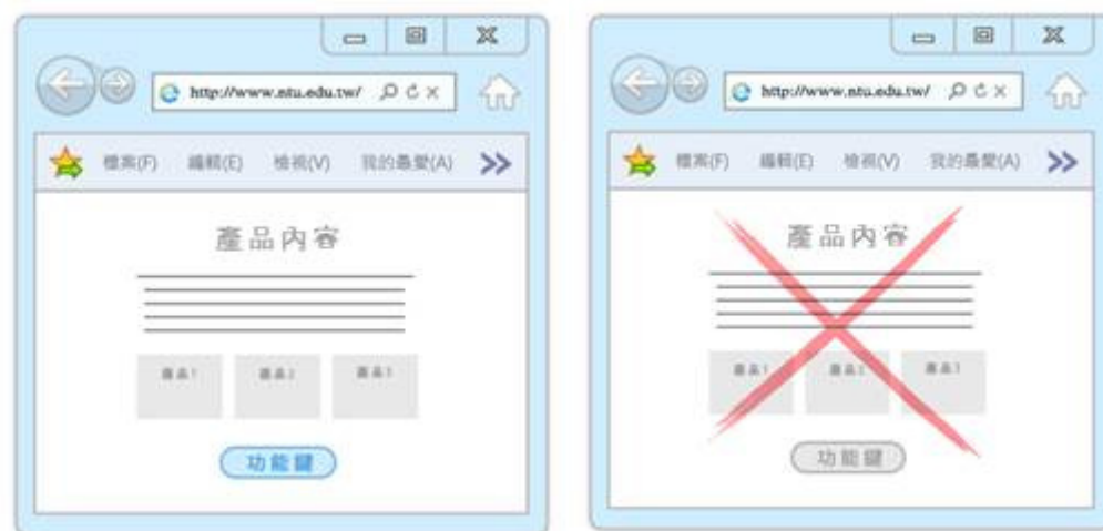
圖 8 圖 9

4-1、善用色彩區分元素（按鈕變化）：善用色彩變化突顯按鈕功能鍵，如此按鈕功能便能與網頁其他元素作區隔。