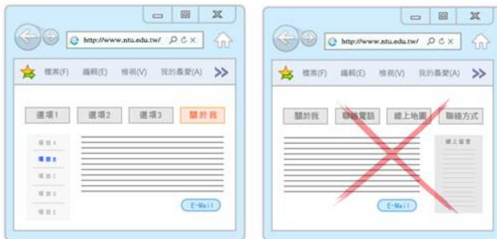
圖 12 圖 13

5、集中整合相似功能：網站相似或重複的資訊過多，會造成使用者無所適從或反感厭煩。可試著將類似功能合併整合，例如聯絡方式、地點、電話、地圖、信箱等相關資訊，整合後保留一個選項即可，避免形成版面雜亂無章的感覺。