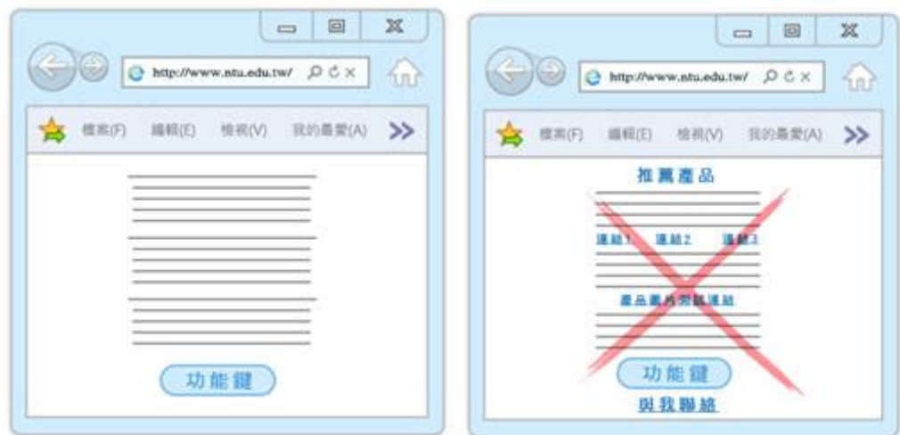
圖 4 圖 5

2、不要分散焦點（集中焦點）：若網頁目的是想誘導使用者，在閱讀網頁後按下按鈕，以引導至目的頁面；建議內容中少用其他的按鈕或連結，這些多餘的連結可能中途會引導使用者跑到其他頁面，甚至離開網頁，而沒有達到成目的最終效果。