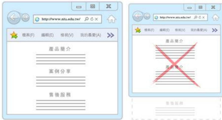
圖 18 圖 19

者在捲動瀏覽的不便；或是可以將內容採用分頁方式取代捲軸設計，如此使用者在閱讀與操作上會比較方便。