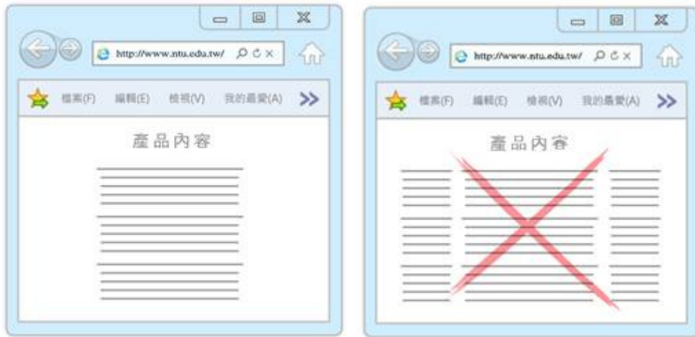
圖 2 圖 3

1、單欄內容優於多欄（集中焦點）：單欄內容由上而下引導讀者閱讀，多欄可能會讓讀者分心。