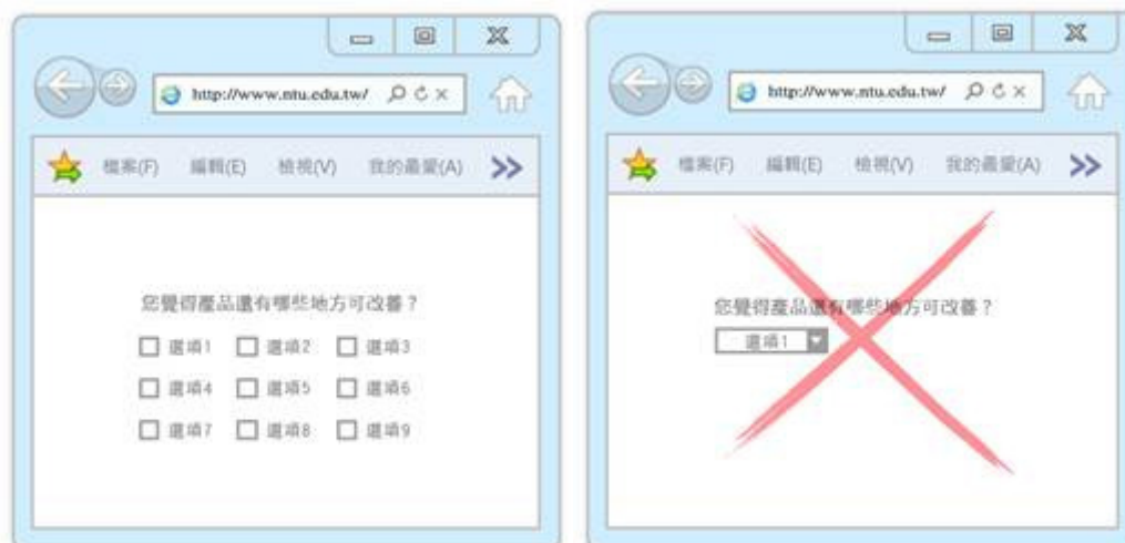
圖 16 圖 17

7、資訊皆可見（選項不隱藏）：下拉式選單雖不佔空間，但卻讓部分選項資訊隱藏，使用者得在手動展開，才能看到其他相關資料。時間、日期、地點等一般資訊可採用下拉式選單，若跟產品服務相關的重要問題選項最好採用並列敘述方式，讓使用者瀏覽網頁就可看到所有重要資訊。