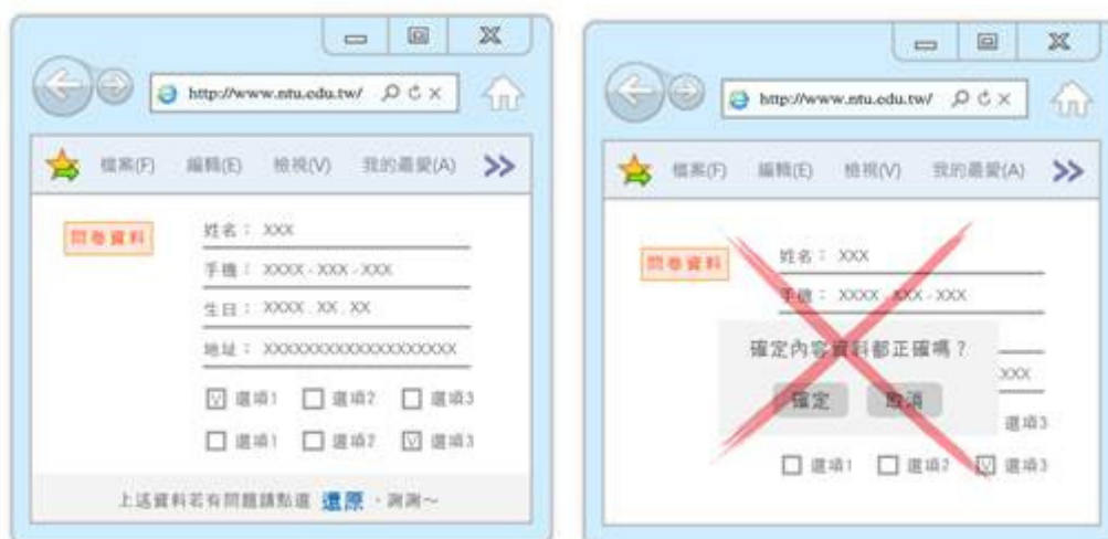
圖 14 圖 15