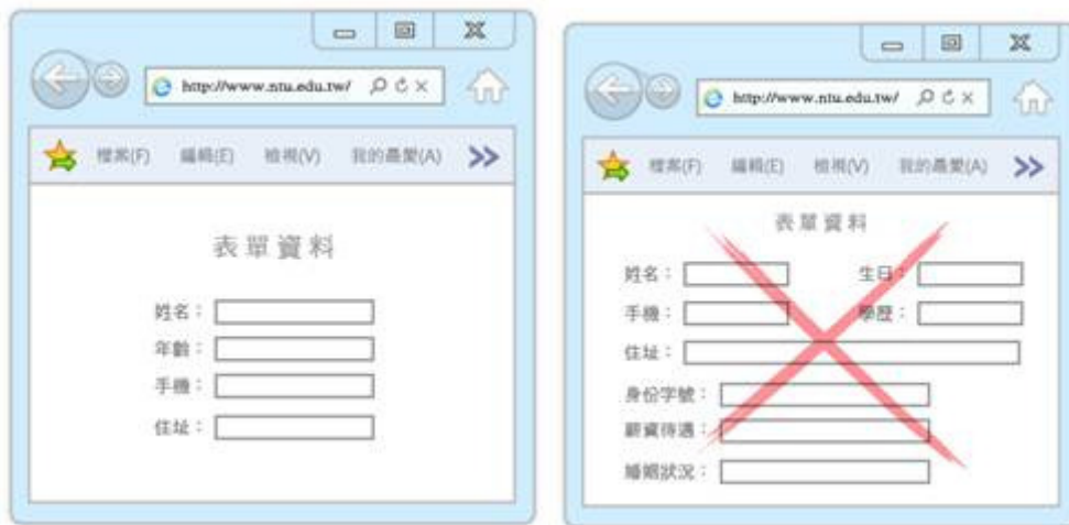
圖 20 圖 21

9、欄位表單精簡化：若表單資料欄位繁多，常會讓使用者填寫到一半就放棄填寫，加上近年以來個資隱私日益注重，建議可將問題精簡化，避免涉及相關隱私的問題。